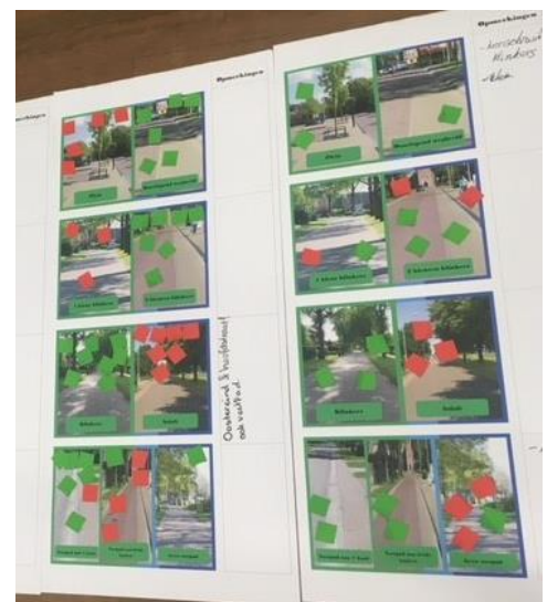
Participatie: inwoners denken mee over het ontwerp

In een eerste sessie zijn inwoners gevraagd naar wensen, knelpunten en prioriteiten op het gebied van verkeer, straatbeeld, groen en riolering. Met deze input heeft Buro Hollema twee inrichtingsschetsen gemaakt. In een tweede sessie zijn deze gepresenteerd en hebben de inwoners meegedacht over het uiteindelijke ontwerp. Met rode ( niet leuk ) en groene ( leuk ) stickers hebben zij hun voorkeur uitgesproken. In een derde sessie is het definitieve ontwerp gepresenteerd aan de inwoners, hun inbreng leidde tot veel draagvlak. Ook tijdens de uitvoering is er bij onvoorziene situaties overlegd om tot een oplossing te komen in de geest van het plan.