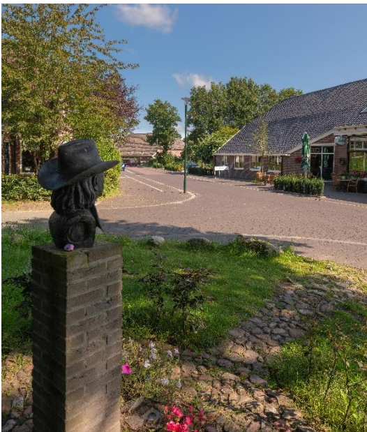
Harry Muskee kijkt uit over de vernieuwde Hoofdstraat

Grolloo kent veel historie die meegenomen is in de planvorming. De bestaande brink met prachtige eikenbomen, het standbeeld van Harry Muskee, en ook niet te vergeten de aanwezige mooie karaktervolle klinkers. Hergebruik hiervan was niet louter ingegeven door circulariteit maar ook door de warme uitstraling van de steen die goed past bij het centrum van Grolloo.