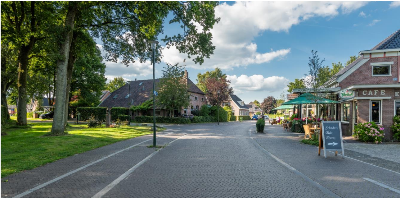
In de centrumzone is geen verschil in materiaal gebruik tussen rijbaan en voetpad. Alle verkeersdeelnemers zijn gelijkwaardig.

De vormgeving is terughoudend en gedetailleerd. Gebruikt zijn degelijke stoere materialen in de vorm van de aanwezige en nieuwe klinkers en antracietkleurige overrijdbare banden. Door de afwezigheid van specifieke aanduidingen zoals parkeervakken is de vormgeving 'low profile' en past daardoor goed bij de gewenste dorps sfeer. De vakkundige strakke uitvoering van de aannemer Aanneming Wegenbouw Hemmen maakt dat het ontwerp goed uit de verf is gekomen.