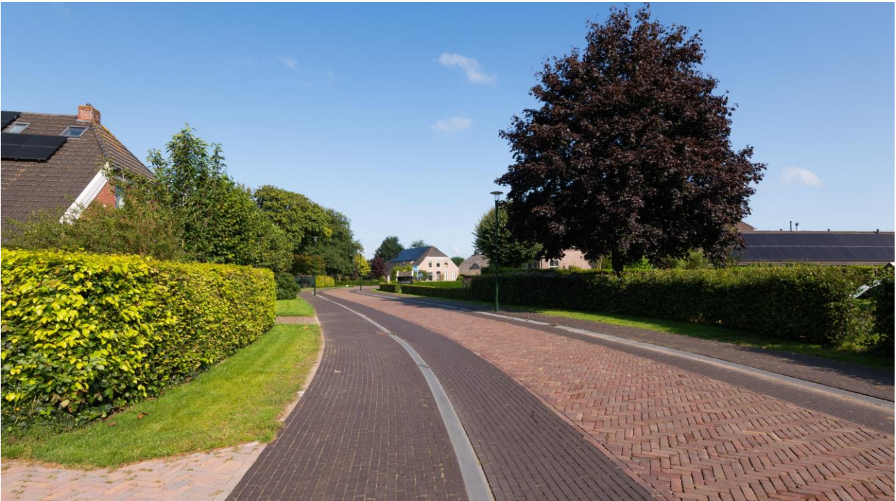
Een terughoudende vormgeving met een strakke uitvoering, passend bij het dorp

De vormgeving is terughoudend en gedetailleerd. Gebruikt zijn degelijke stoere materialen in de vorm van de aanwezige en nieuwe klinkers en antracietkleurige overrijdbare banden. Door de afwezigheid van specifieke aanduidingen zoals parkeervakken is de vormgeving 'low profile' en past daardoor goed bij de gewenste dorps sfeer. De vakkundige strakke uitvoering van de aannemer Aanneming Wegenbouw Hemmen maakt dat het ontwerp goed uit de verf is gekomen.