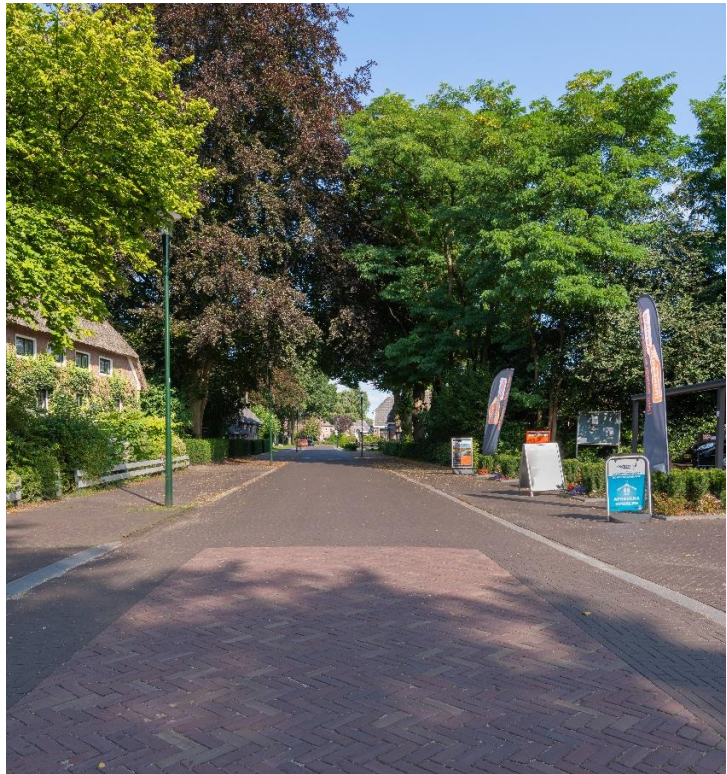
Overgang zones richting en in centrum

In de centrumzone is geen verschil in materiaal gebruik tussen rijbaan en voetpad. Alle verkeersdeelnemers zijn hier gelijkwaardig. Geen technische verkeerskundige oplossingen maar op z'n Grolloos: Kalm an!