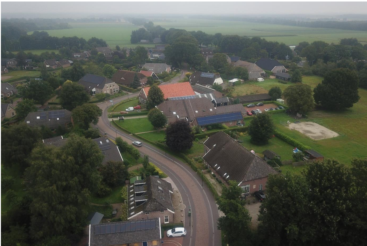
Een goed bij Grolloos passende Hoofdstraat, met ruimte voor de verkeersfunctie en de gewenste dorps verblijfskwaliteit

Door een open houding en goede samenwerking tussen de gemeente Aa en Hunze, inwoners, Buro Hollema en Aanneming Wegenbouw Hemmen is het mogelijk geweest het maximale uit de vraag te halen en is het resultaat meer dan de som der delen.